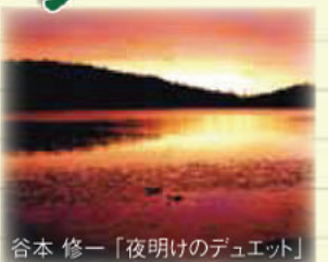
谷本 修一「夜明けのデュエット」